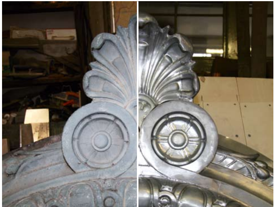
Detaillierter Vergleich: Ein neues Sporer-Ornament neben dem mehrfach lackierten Original. Stumpf gelötete Nahtstellen werden ausnahmslos mit Nahtstreifen hinterlegt