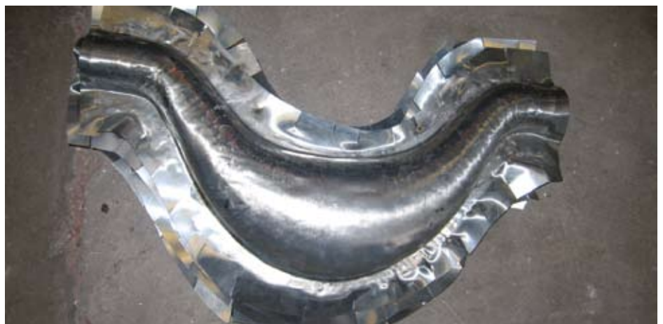
Form und Titanzink-Grundkörper der neuen noch ungeschmückten Girlanden