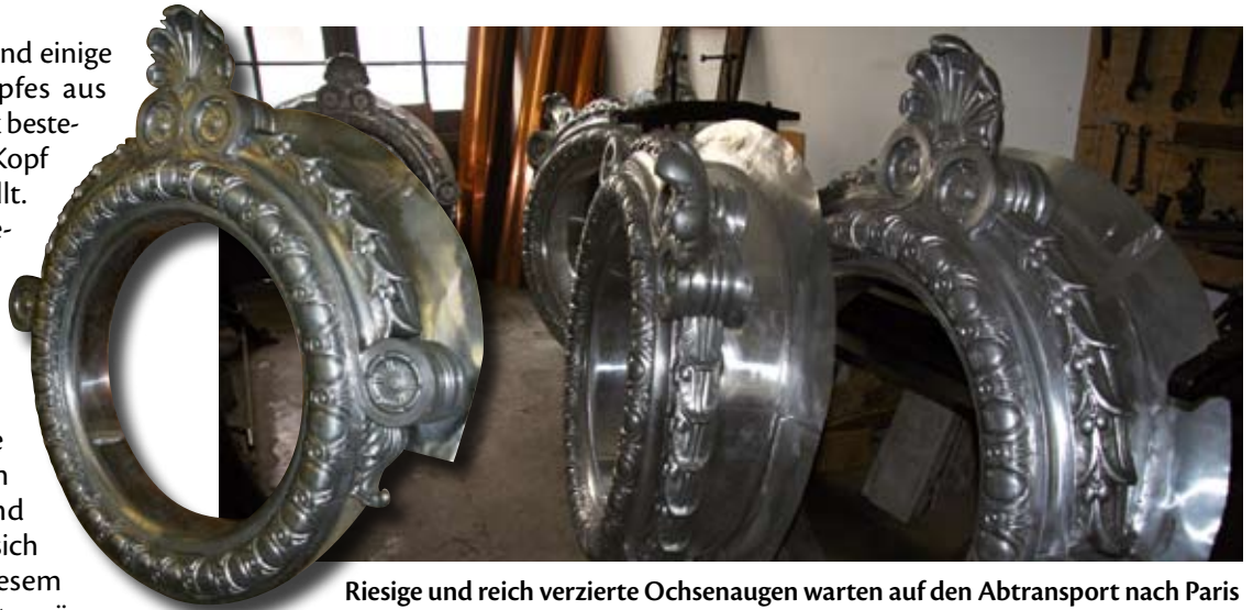
Riesige und reich verzierte Ochsenaugen warten auf den Abtransport nach Paris

In der Ornamentenspenglerei Sporer stehen weitere Ochsenaugen, Löwenköpfe und Girlanden aus Zink. Die Ornamente gehören zu einem von acht Türmen des altherwürdigen Pariser Kaufhauses „Au Printemps“ am Boulevard Haussmann, unweit der Galerie Lafayette, einem ebenfalls bekannten Pariser Warenhaus. Aktuell wird das 1865 erbaute Printemps aufwendig restauriert. Vor allem die Gauben und Turmbekrönungen samt prunkvoller Zinkornamente haben im Laufe der Zeit starke Schäden erlitten. Einige Zierstücke drohten gar in die Tiefe zu stürzen, weshalb zum Schutz der Passanten unschöne Netze über die Gauben gespannt wurden. Bekannt ist das Printemps auch für seine 1923 errichtete Jugendstil-Glaskuppel, unter der sich heute das Café Flo befindet. Seit 1975 gelten Fassade und Kuppel des Kaufhauses offiziell als historisches Monument. Den umfangreichen Auftrag zur Sanierung der Turmhaube erhielt die Lorenz Sporer GmbH, welche die Firma Kaufmann aus Neu-Ulm als Subunternehmer ins Boot holte, um eine termingerechte Lieferung bei dieser umfangreichen Arbeit zu erreichen. Schon öfter wickelte das eingespielte Firmenduo Aufträge wie diesen ab – beispielsweise bei der Rettung des Thermengebäudes im französischen Evian (siehe BAUMETALL 3/2007) – doch keiner dieser Aufträge gleicht dem anderen. »