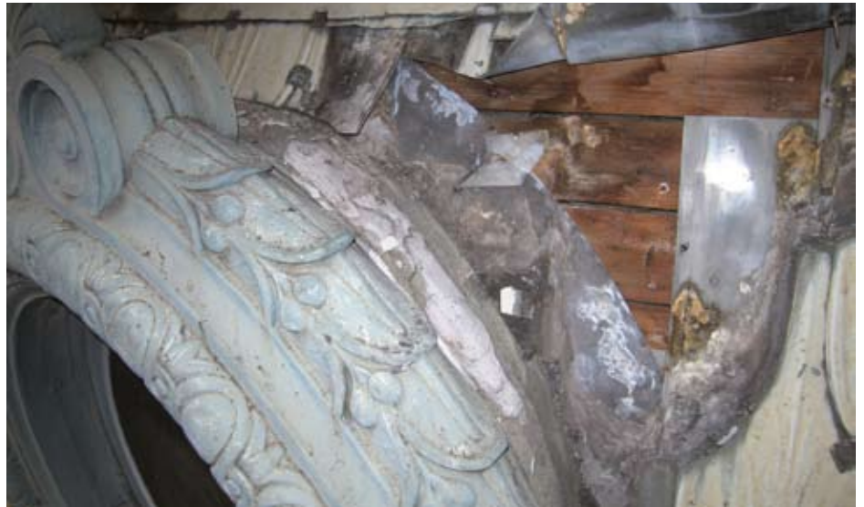
Nach der Demontage der alten Rundfenster kam eine weitestgehend gut erhaltene Holzunterkonstruktion zum Vorschein